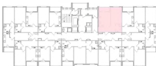
СХЕМА БУДИНКУ № 1 2-23 поверхи