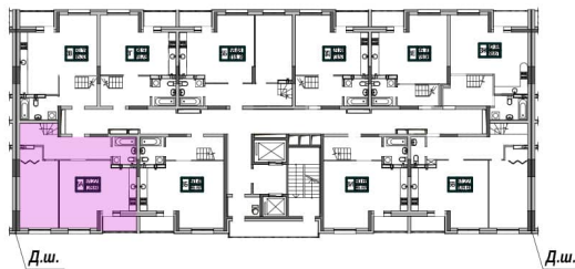
План секції 1.2