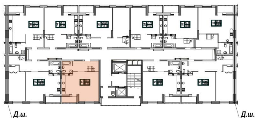
План секції 1.2