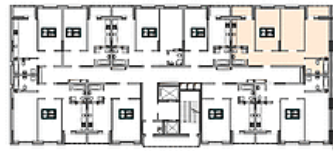
План секції 1.1