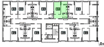
План секції 1.1