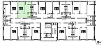
План секції 1.1